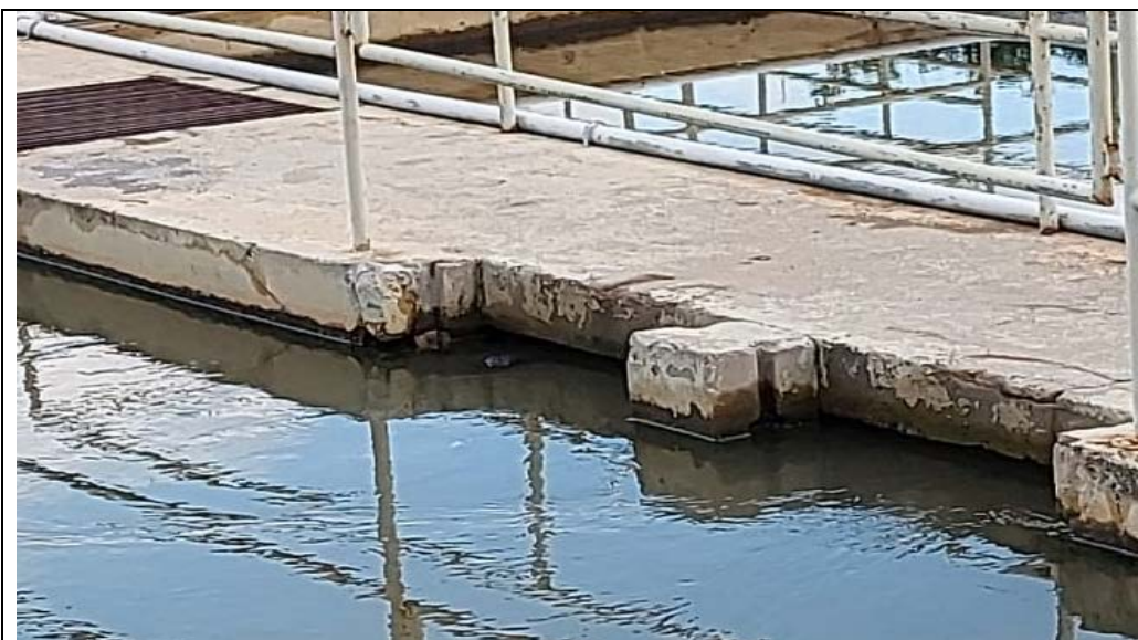
Fig. 03 - Saída da calha de estabilização / entrada no decantador 02