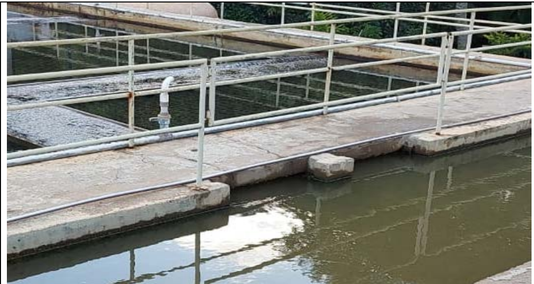
Fig. 01 - Saída da calha de estabilização / entrada no decantador 01