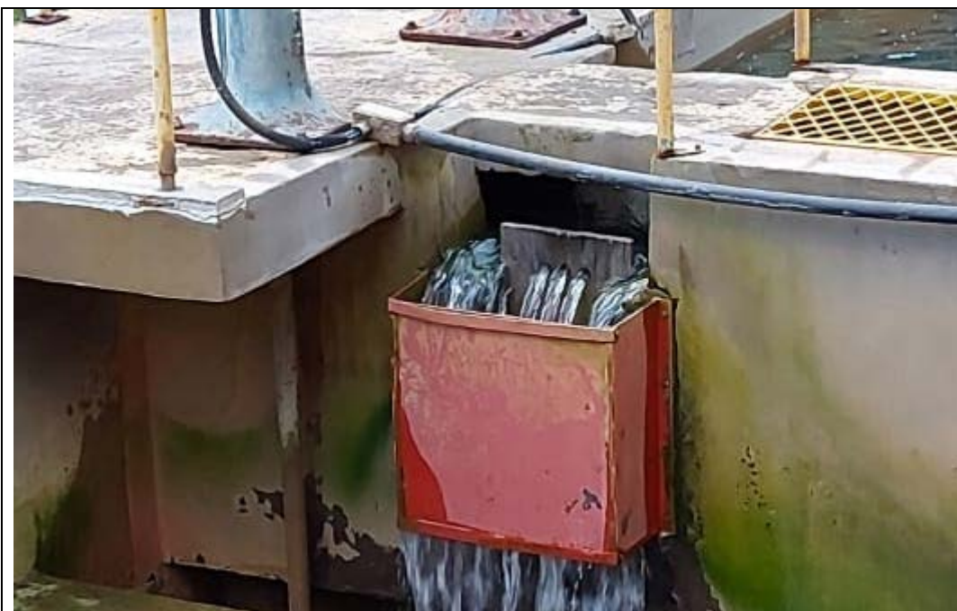
Fig. 11 – Filtros 3 e 4