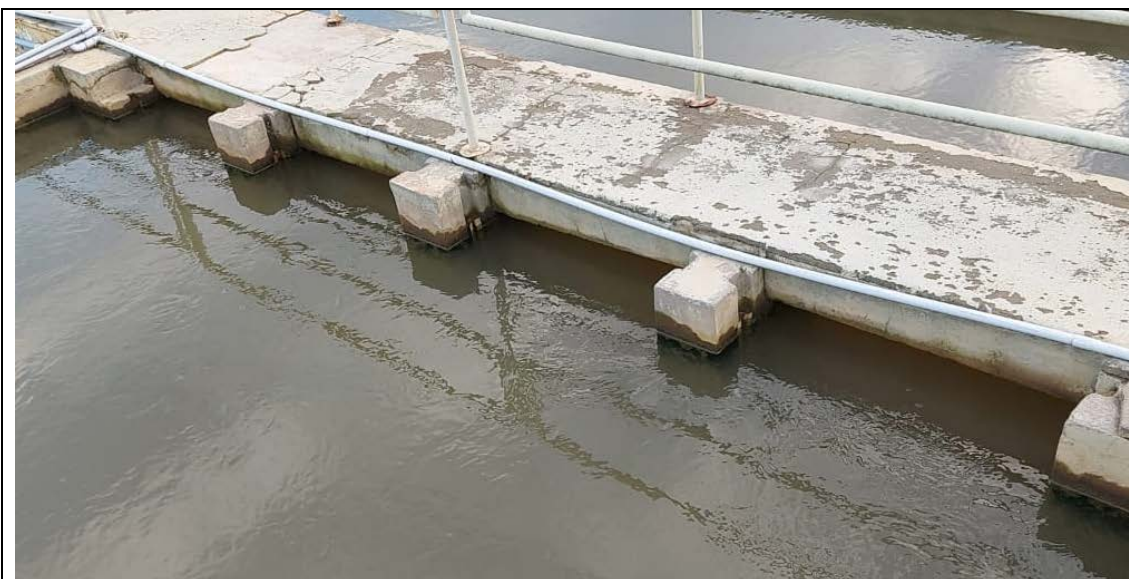
Fig. 07 - Saída do floculador 02/entrada da calha de estabilização