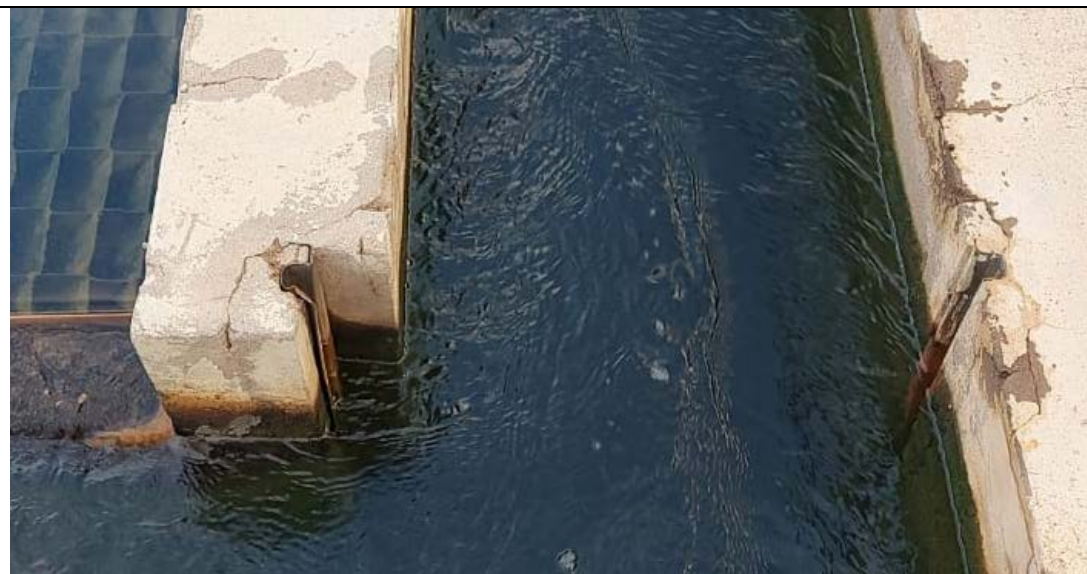
Fig. 02 - Saída do decantador 02 / calha de distribuição para os filtros