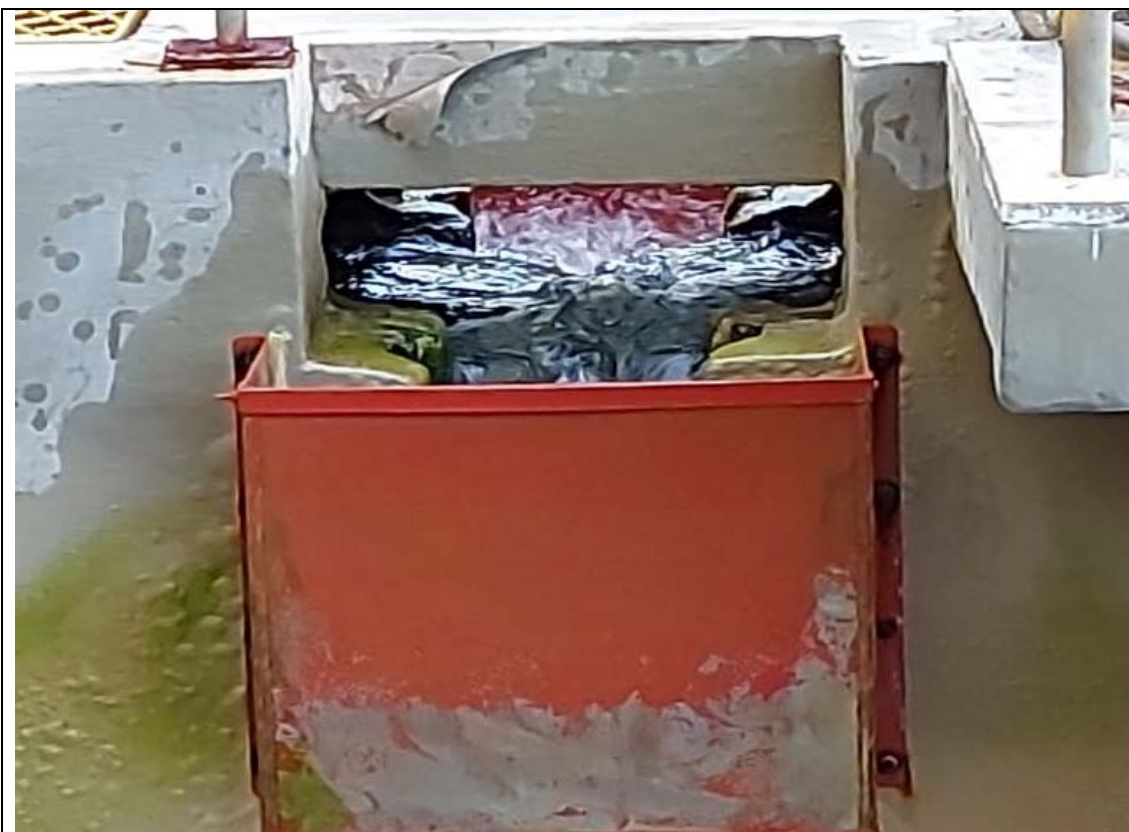
Fig. 09 - Filtros 7 e 8