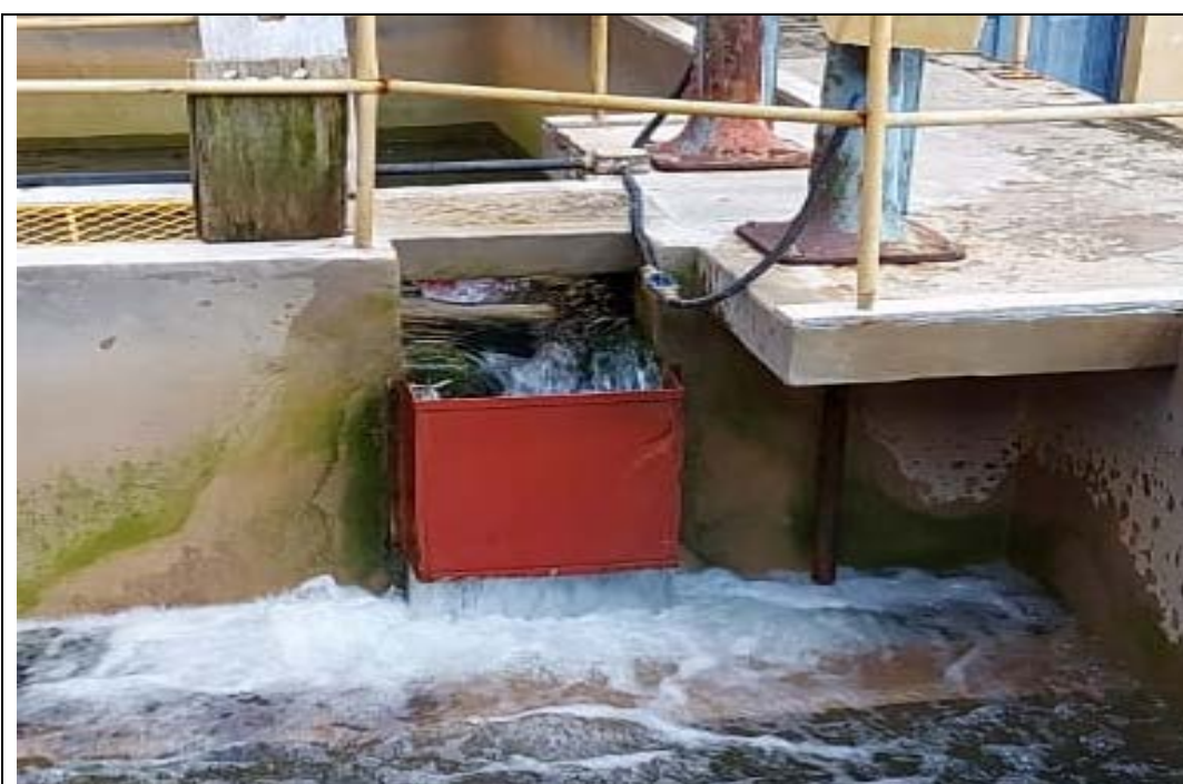
Fig. 12 – Filtro 1 e 2