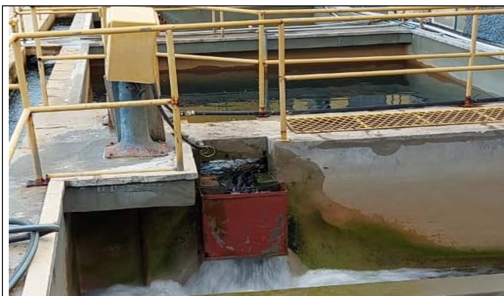
Fig. 04 - Filtros 5 e 6