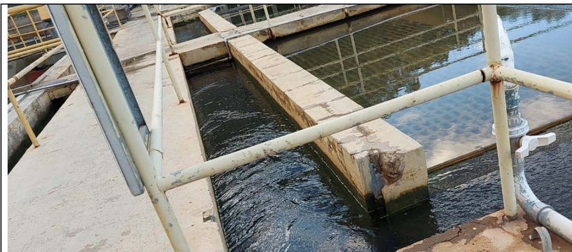
Fig. 10 - Saída do decantador 01 / calha de distribuição para os filtros